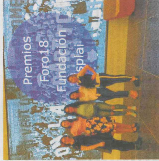
La entrega se ha hecho en el Foro Fundación Esplai 2018.

Los líderes y lideresas se han convertido en referentes para sus iguales, hombres y mujeres de Vallecas —muchos de ellos de etnias minoritarias y en situación de vulnerabilidad social—, incluyendo valores de igualdad y respeto. Con un fin último, el de acabar con la violencia de género.