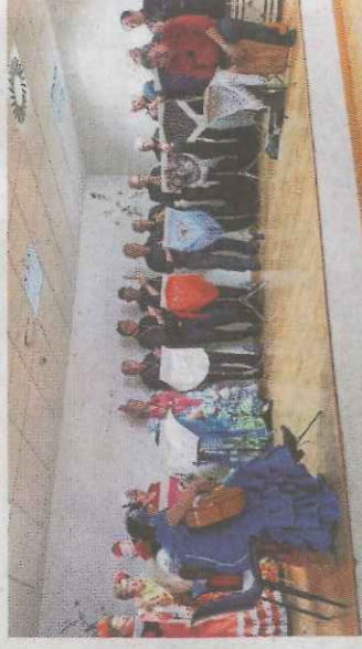
El grupo Oro Viejo actuará el viernes 15.